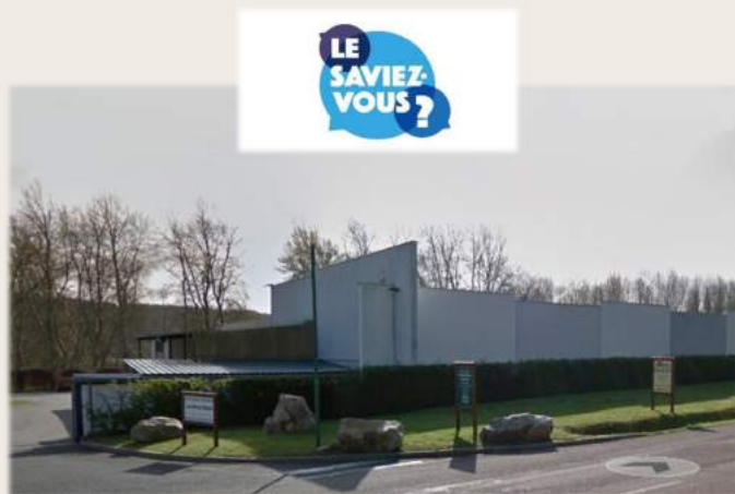
Le Sigal 1 a été inauguré en février 2006 et le Sigal 2 en décembre 2010. Ce dernier a été lauréat du concours Aménagement Exemple en Essonne en 2011.

Suivez l'actualité de votre ville au quotidien sur la page Facebook @PrunaysurEssonne et sur www.prunaysuressonne.fr