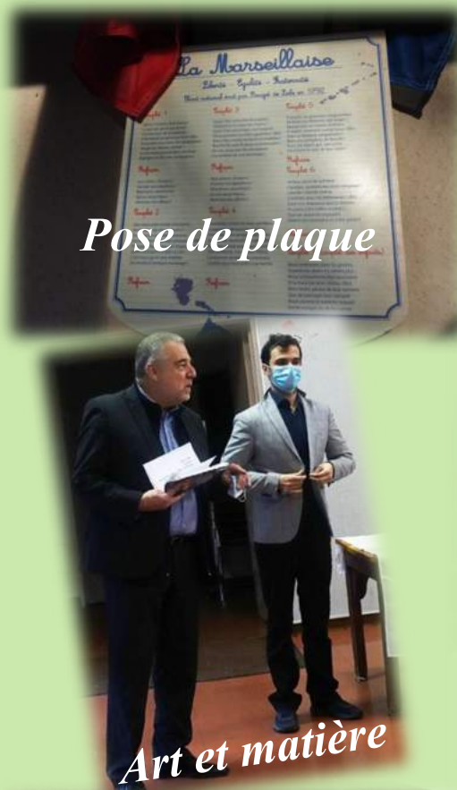
Pose de plaque