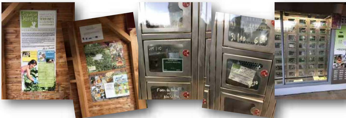
Distributeur près de la société Daregal