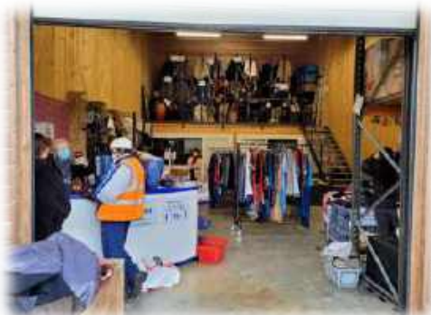
La friperie de la Recyclerie