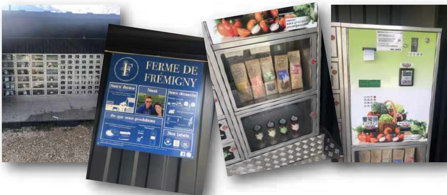
Distributeur près de la Piscine Alain Bernard à Milly la Forêt