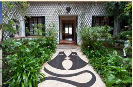
14, rue Jean Cocteau 06000 Saint Jean Cap Ferrat Tél : 04 93 76 00 16 www.villasantosospir.fr