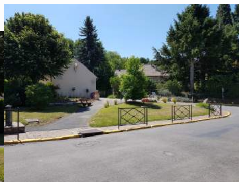
Barrières et lignes jaunes interdisant le stationnement et l'arrêt le long de la Mairie