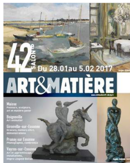
Affiche Officiel « Art et Matière 2017 »

Un grand merci à l'organisation d'art et matière et les employés communaux toujours présents pour les installations.