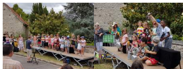
Spectacle des enfants de l'école de Prunay