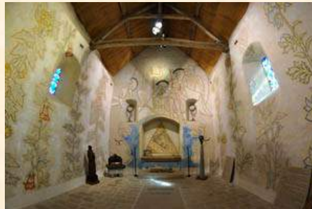
Chapelle Saint Blaise Rue de l' Amiral de Gravelle 91490 Milly-la-Forêt Tél : 01.64.98.84.94 www.chapelle-saint-blaise.org/