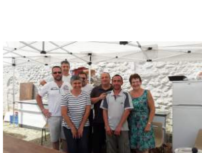
Une partie des bénévoles

Merci à tous les bénévoles pour leur aide non seulement pendant ces deux jours mais aussi pour les préparatifs et le rangement.