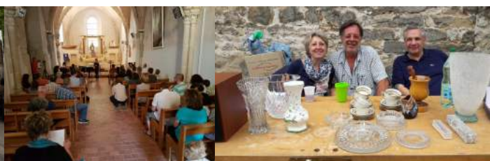
Participants au vide grenier