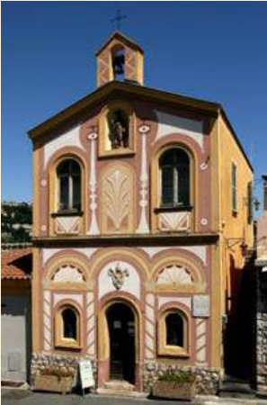
Chapelle de Villefranche sur Mer 1, quai Courbet 06230 Villefranche sur Mer Tél : 04 93 01 73 68 www.le-sud-jean-cocteau.org