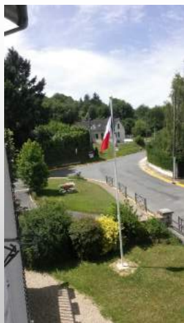
Drapeau qui surplombe le perron de la Mairie