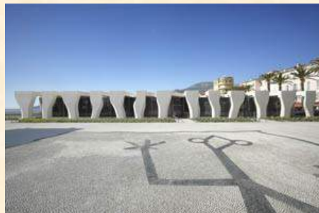
Musée Jean Cocteau 2, quai de Monléon 06500 MENTON Tél : 04 89 81 52 50 www.museecocteaumenton.fr