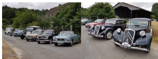
Exposition de voitures anciennes