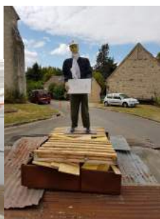
Mr Carnaval avant / après