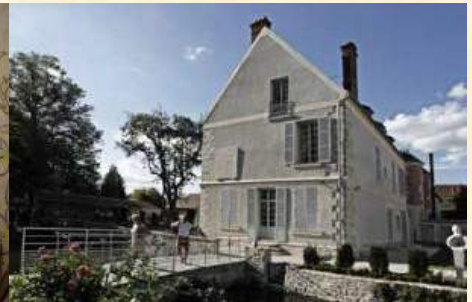
Maison de Jean Cocteau 15 rue du Lau 91490 Milly-la-Forêt Tél : 01 64 98 11 53 www.maisoncocteau.net